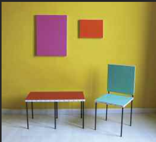
1 Olivier Liégent, Living Paintings , installation : mur peint, tableaux, table, chaise ; peinture acrylique, toiles sur châssis, structures en acier, 2001.