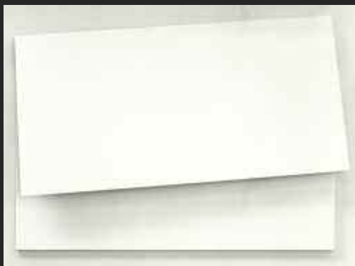
6 François Morellet, Raz de marée , 1987.