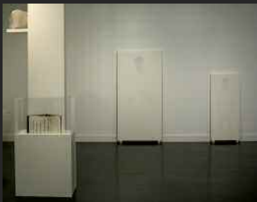
7 Jean-Marc Cerino, Passage de témoins / Témoin de passages , La Galerie de l'arthotèque, Bibliothèque de la Part-Dieu, Lyon, 2004.