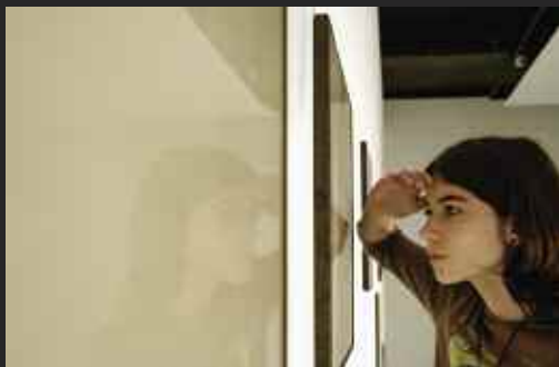
3 Jean-Pierre Bertrand, Regarder au plus près ce qui est lointain , 2004. D.R.