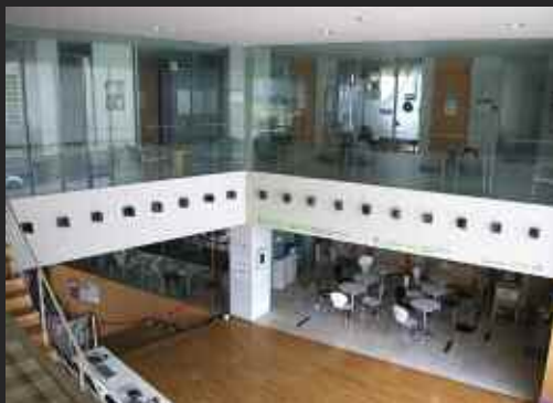
2 François Perrodin, "51.37", 36 éléments 15x15x15 cm. ; bois, peinture acrylique ; Na&Lee Art Center, Gimpo, Corée.