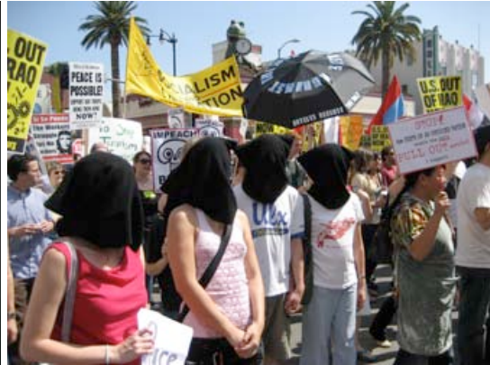
BOOMERANG , digital video, 23 :23 minutes, 2006, installation view at The Office: An Art Space. March 17-18, 2007 (Hoods) , anti-war protest performance, Hollywood, California, 2007.