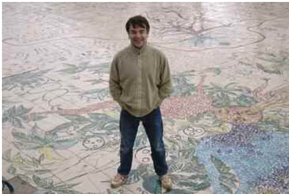
12. L'artère , 2003/2005, Parc de La Villette.