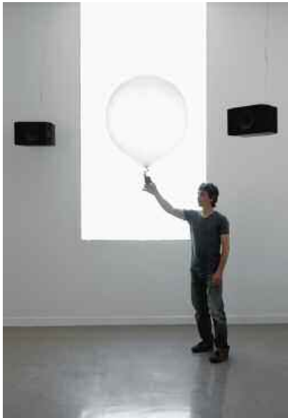
2. Scanner , prototype, technique mixte, dimensions au sol 8 x 8 m., 2006. Ballon en latex gonflé à l'hélium, microphone sans fil, système de traitement et de diffusion audio multicanal, ventilateur. Collection du Fnac (Fonds National d'art contemporain), France.