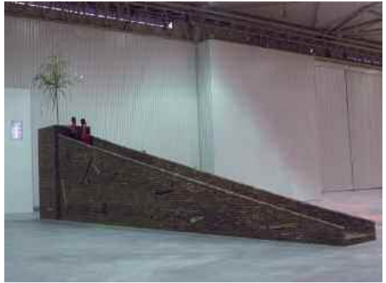
4. There is here, here is there , Chengdu Biennale, 2005.