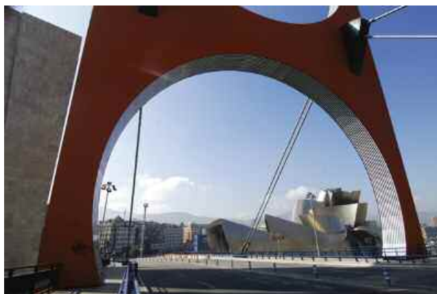
9. Photo-souvenir : Arcos rojos, travail in situ , Puente de la Salve, Bilbao, 2007. Détail.