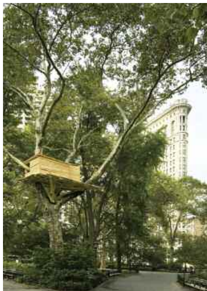
6. Tree Huts , 2008. Installation in situ, dimensions variables, bois. Vue de l'exposition Tree Huts , Madison Square garden, New-York. © The artist. Photo : Ellen Page Wilson. Courtesy the artist and Kamel Mennour, Paris.