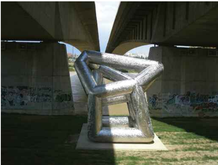
16. Water Under The Bridge , 2008, Zaragossa, Spain. D.R.