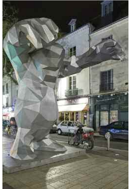
15. Xavier Veilhan, Le Monstre , 2004. Installation Place du Grand Marché, Tours.