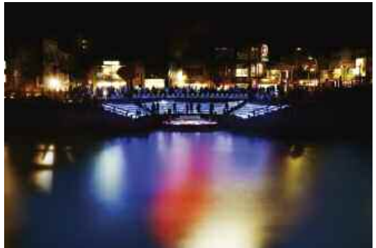
5. Luminous BandGap , 2009.