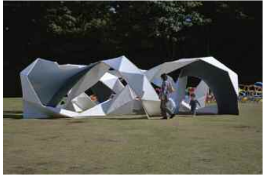
3. Ueno Park, Chyac Park Project.