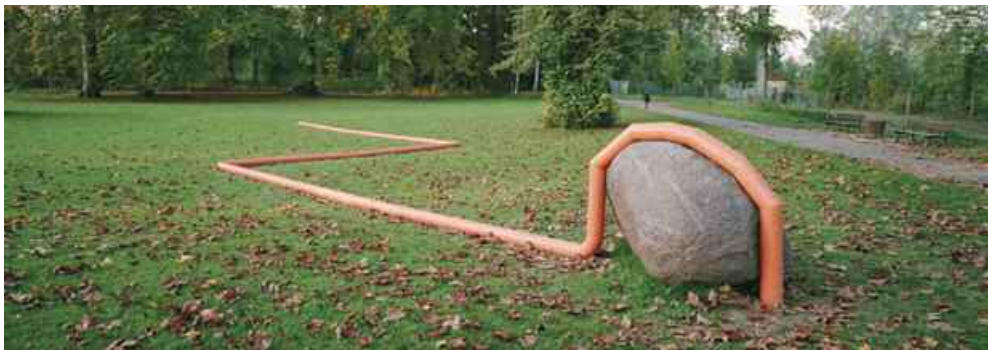
13. Détour , 2005, parc de sculpture de Pourtales.