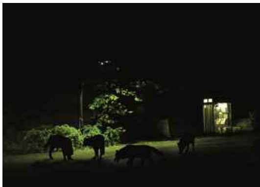
7. La Meute , 2008. Photo : Stéphane Thidet.