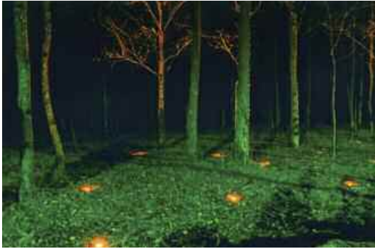
14. Véronique Joumard, Le circuit des lumières , 1996. Partenaires : Fondation de France, Initiative Européenne Leader II, commune de Grancey-le-Château et SISECO, mécénat iGuzzini.