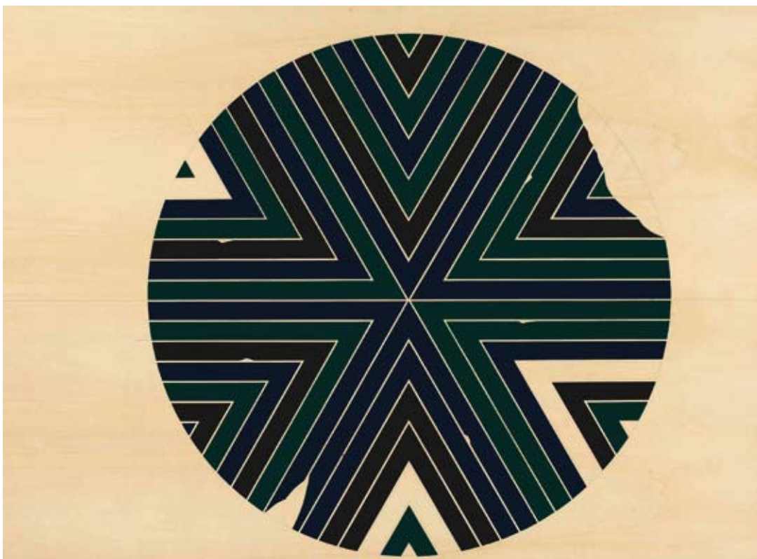
Jens Wolf - Sans titre - Collection FRAC Auvergne