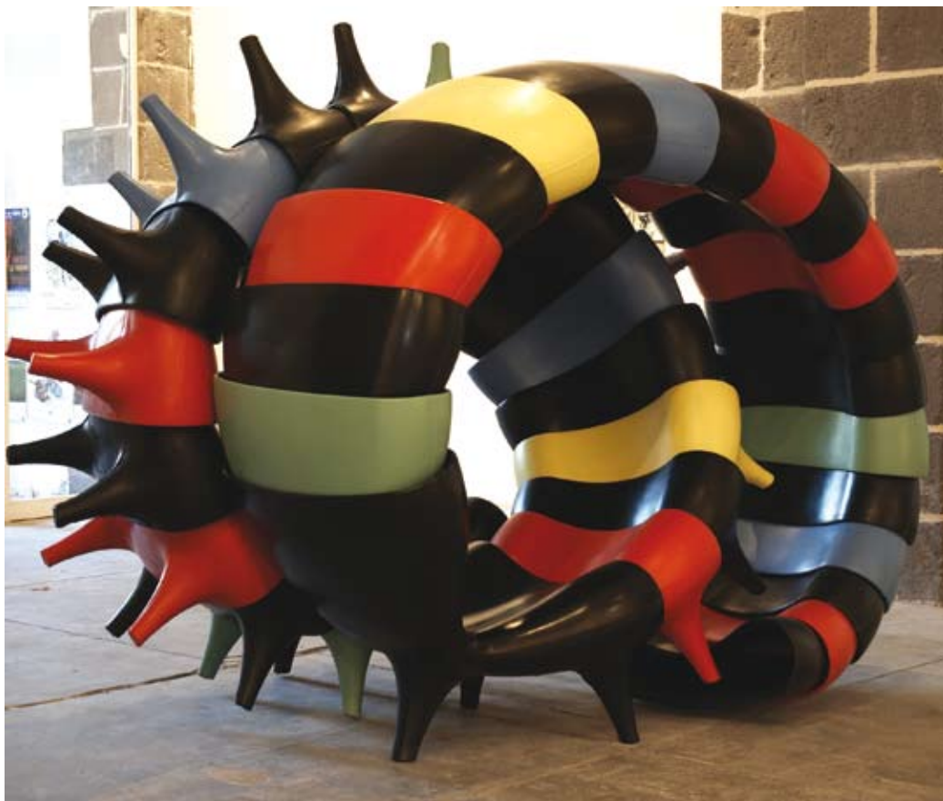
Etienne Bossut - Grand Laocoon - Collection FRAC Auvergne