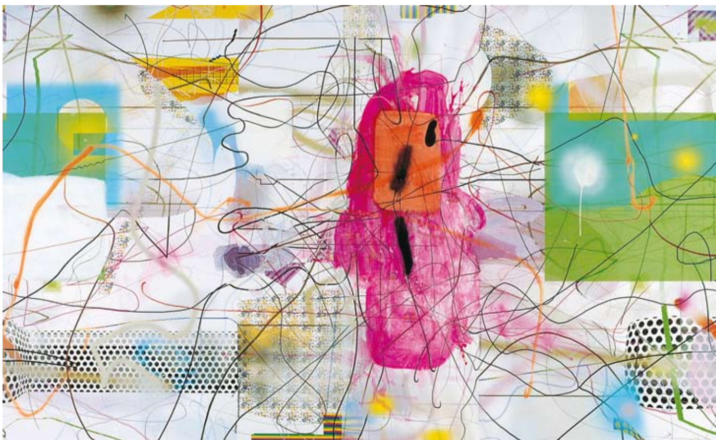
Albert Oehlen - Sans titre - Collection FRAC Auvergne