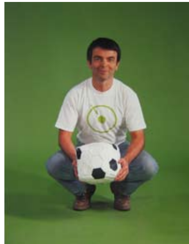
Fabrice Hyber, Les Empêcheurs de tourner en rond, pour la coupe du monde de foot 1998 avec la FNAC.

Fortement ancré autour des talents et de l'économie de la région nantaise mais également ouvert à la