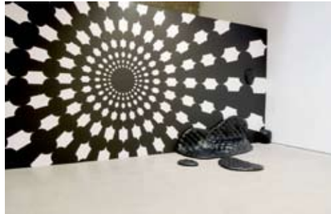
Exposition Design'in présente Living Box , 2008 - conception : Frac des Pays de la Loire, avec le concours de l'Écomusée et d'Escal'Atlantic, Saint-Nazaire - Hangar à bananes, Nantes - Projet financé par la Région des Pays de la Loire.

La Région Pays de la Loire s'engage pour la créativité et l'innovation : elle promeut aussi souvent que possible les croisements entre création artistique et développement de l'activité économique.