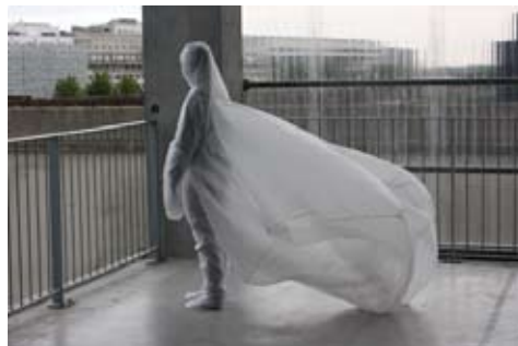
Ensa, Temple du Goût, websites and city of Nantes