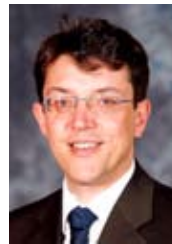
Christophe Clergeau , First Vice President of the Regional Council of Pays de la Loire;