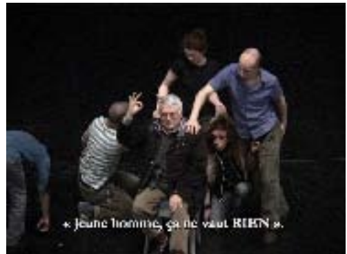
Théâtre Graslin, Nantes