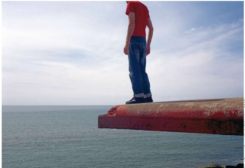
Neal Begg's, 'Some Kind of Meaning', 2003

ÉCOLE SUPÉRIEURE DES BEAUX-ARTS DE NANTES MÉTROPOLE EUROPEAN LEAGUE OF INSTITUTES OF THE ARTS ECCE INNOVATION NANTES MÉTROPOLE RÉGION DES PAYS DE LA LOIRE CHAMBRES DE COMMERCE ET D'INDUSTRIE NANTES ST-NAZAIRE MUSÉE DES BEAUX-ARTS DE NANTES FRAC DES PAYS DE LA LOIRE PLATFORM, REGROUPEMENT DES FONDS RÉGIONAUX D'ART CONTEMPORAIN UNIVERSITÉ DE NANTES UNIVERSITÉ D'ANGERS ÉCOLE NATIONALE SUPÉRIEURE D'ARCHITECTURE DE NANTES ÉCOLE SUPÉRIEURE DES BEAUX-ARTS D'ANGERS ÉCOLE SUPÉRIEURE DES BEAUX-ARTS DU MANS ÉCOLE DE DESIGN NANTES ATLANTIQUE ASSOCIATION NATIONALE DES DIRECTEURS D'ÉCOLES D'ART